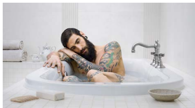
sopra | Room 322, Guest 234

Intraprendente ritrattista e personaggio di grande sensibilità, questo giovane fotografo bolognese si avvicina al mondo della fotografia per una consapevole casualità. Dopo un percorso di studi lontano dalla fotografia, si accorge che da semplice compagno di viaggio l'affezionato hobby poteva diventare qualcosa di più. A oggi, con otto anni di esperienza professionale alle spalle, Francesco Ridolfi è un fotografo attivo sia in ambito commerciale che in ambito artistico e i suoi lavori vantano riconoscimenti e pubblicazioni in ambito nazionale e internazionale. Ha scelto come forma espressiva principale il ritratto perché «nessun soggetto mi seduce come il volto umano. E credo non ci sia niente di più affascinante che creare un contatto con i tuoi modelli: in quel momento le soggettività in gioco sono due e il fruitore è più libero di interpretare e di farsi coinvolgere».