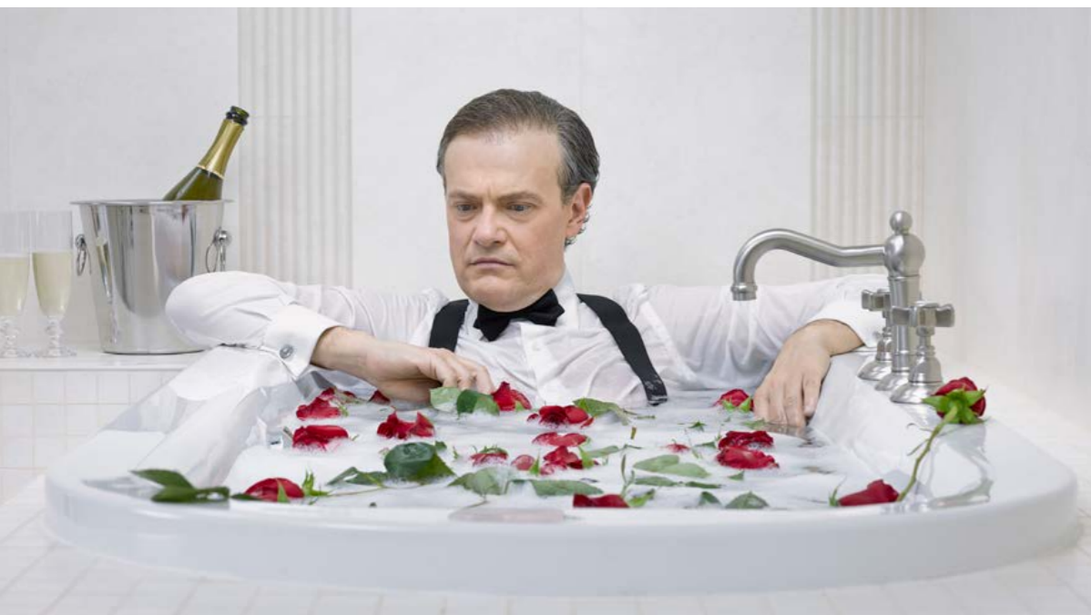
sopra | Room 322, Guest 475